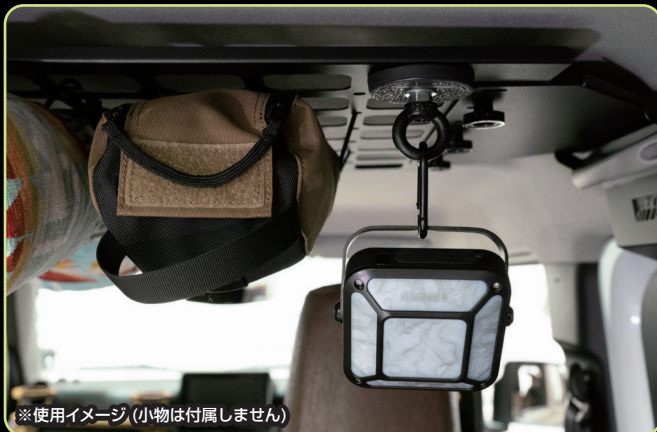
※使用イメージ (小物は付属しません)