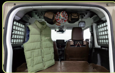
コードなどでのアレンジもOK